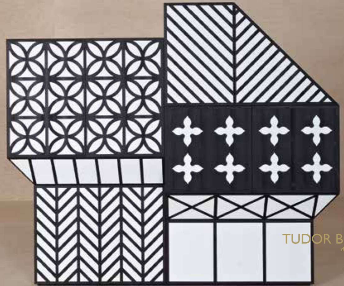
TUDOR BONANZA design Ferruccio Laviani