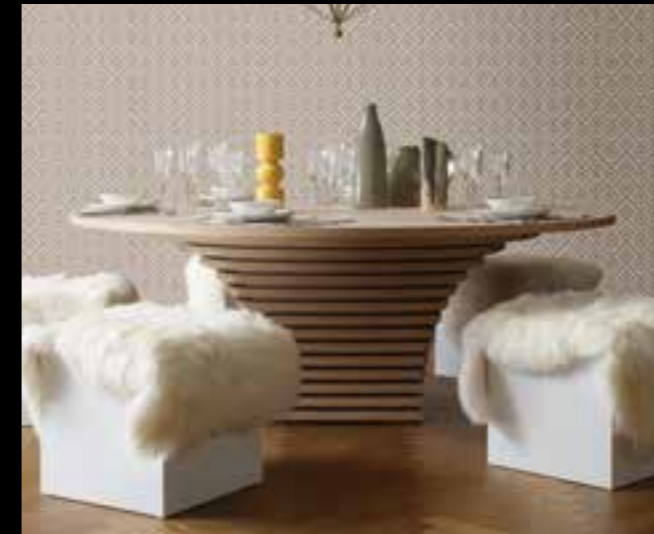
PALERMO design Ferruccio Laviani