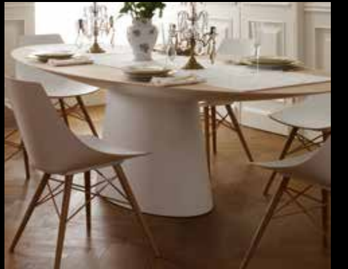
GLEE/UFO design Ferruccio Laviani