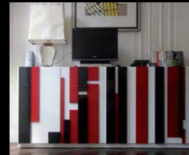
MODULAR design Ferruccio Laviani