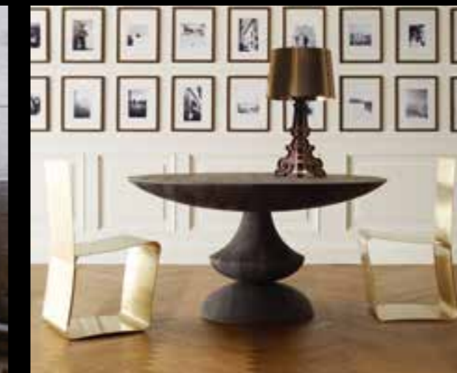
KIA design Giuseppe Viganò BIRIGNAO design Ferruccio Laviani