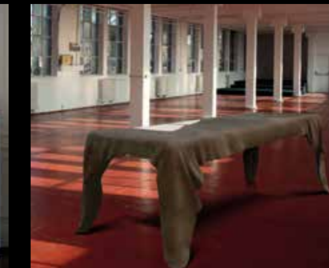
TWAYA design Ferruccio Laviani