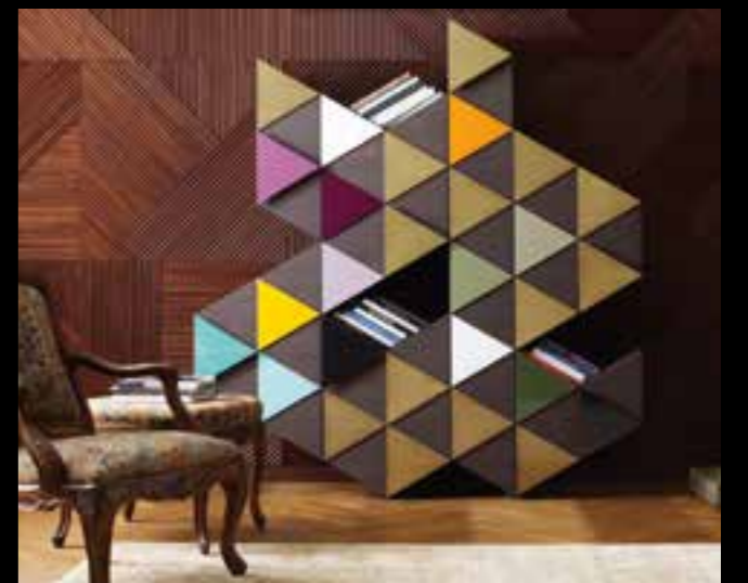
ARLEQUIN design Ferruccio Laviani