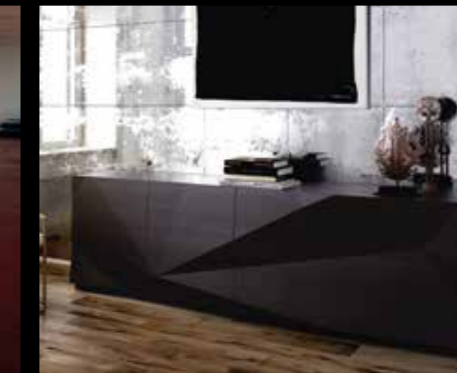
CRASH design Ferruccio Laviani