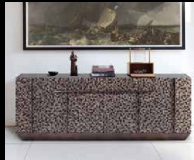
SENECA design Ferruccio Laviani